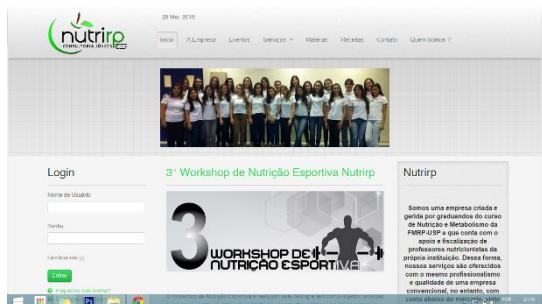
Website da empresa júnior do curso de Nutrição da USP Ribeirão Preto http://www.nutrirp.com.br/