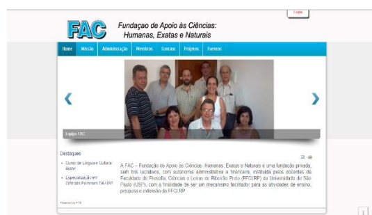
Portal informativo para a Fundação de Apoio às Ciências Humanas, Exatas e Naturais (FAC) http://www.fachen.org.br/