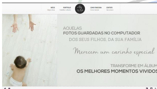
Website de divulgação do trabalho de uma designer http://thebestbook.com.br/